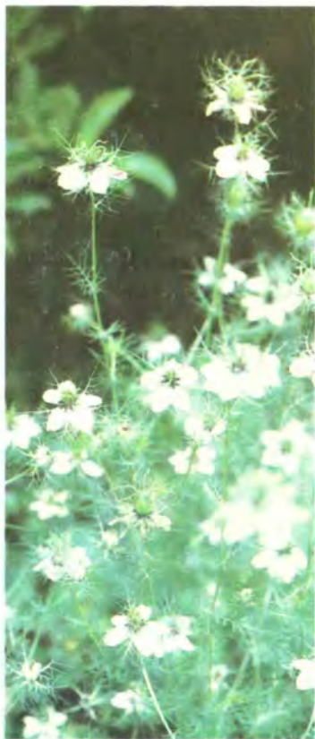
720. Чорнушка польова.